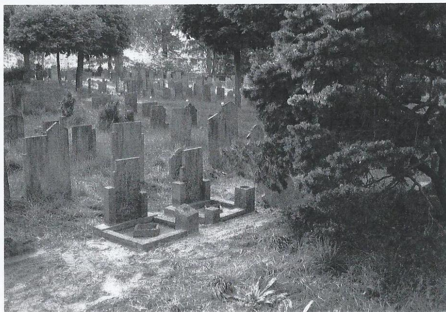
Het resultaat: o.a. bloembakjes weer boven de grond.