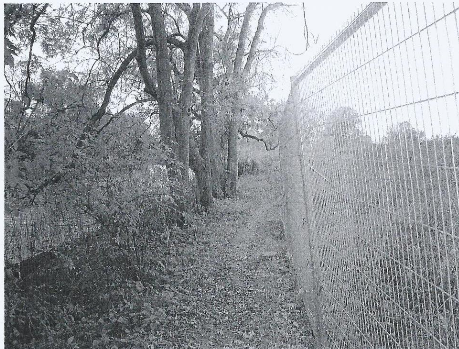
De achterzijde van de uitbreiding van IJsselhof met links de IJssel en het te overbruggen hoogteverschil.