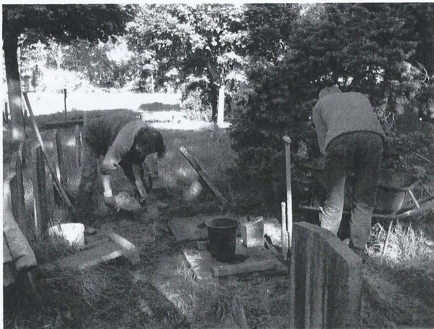
Werkzaamheden op een mooie zaterdag in november 2007