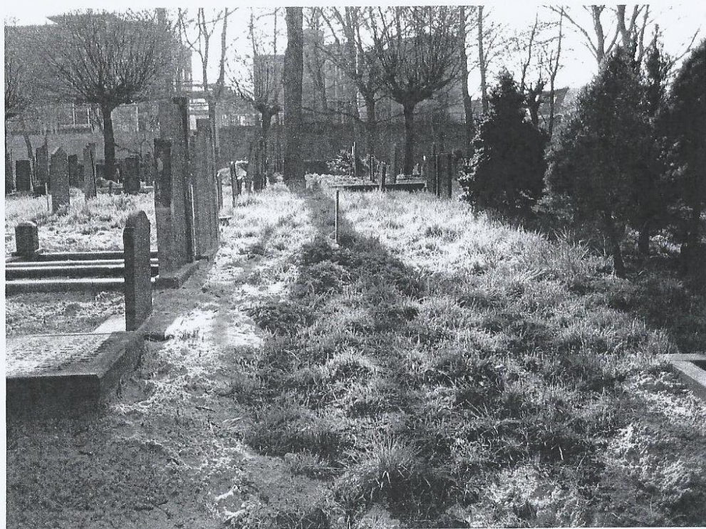
De driehoek, tussen rij mmm en III waar zoveel doodgeboren- en jong gestorven kinderen begraven liggen.

Het zou misschien zinvol zijn om in de nabije toekomst een gedenkteken te plaatsen om deze groep kinderen te herdenken.