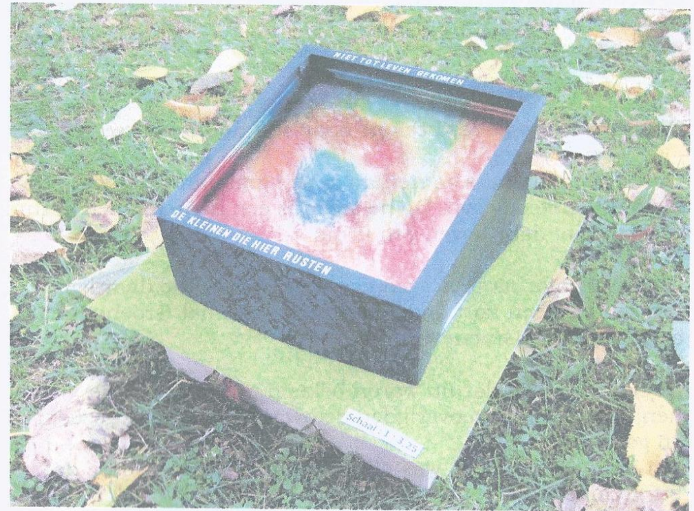
De maquette van het gedenkteken.

Via uitzending gemist van Gouwestad TV kunt het programma alsnog bekijken. www.gouwestad.nl