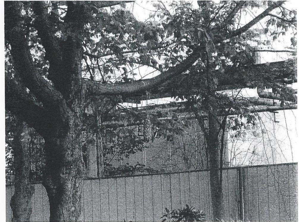
Onze grote bonte specht bezig aan zijn maaltijd.