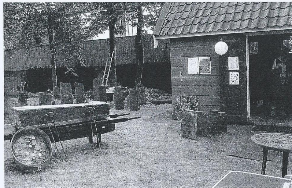
Klaar voor de bezoekers