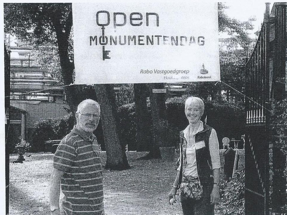
He, He, het spandoek hangt op.