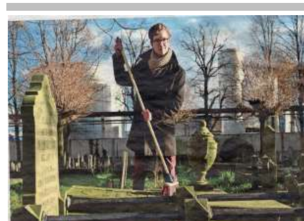
Onze secretaris in een andere functie

Wanneer een zerk, die volledig begroeid is met gras, schoongemaakt wordt, dan komt er zo nu en dan een dropje in het midden terug. Vroeger hebben bloemen daarin gestaan. Tussen het gras worden nog wel restanten van de kettingen gevonden. Het is dankbaar werk om dit te doen, maar dan voor vrijwilligers. Bent u die vrijwilliger die een graf onder zijn/haar hoede wil nemen? Toch worden niet alle graven opgeknapt. Het blijft een stokoude begraafplaats waar niet alles tot in de puntjes verzorgd meer is.