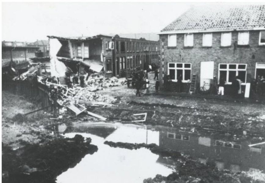
Noothoven van Goorstraat, 18 mei 1941