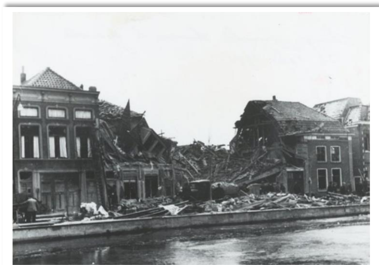
Fluwelensingel, 26 februari 1941