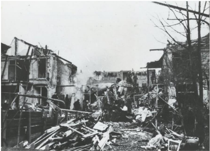
Boelekade, 6 november 1944