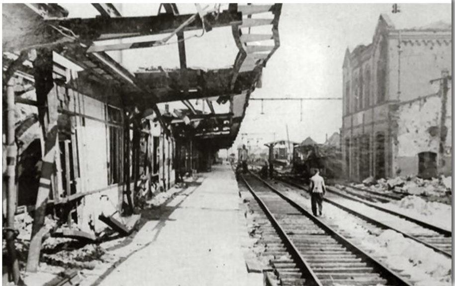
Station van Gouda

Uit de stukken over de bombardementen bleek wel dat zij brandwonden had, maar het bombardement had overleefd. De brandwonden bleken uiteindelijk toch voor haar fataal te zijn geweest. Mede omdat in de overlijdensakte geen doodsoorzaak werd vermeld, er nog meerdere bombardementen waren tussen 6 november en 30 november, is er nooit een verband tussen haar overlijden en het bombardement gelegd.