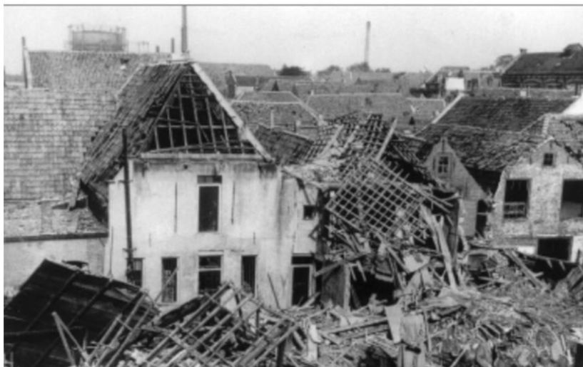
Nobelstraat, 18 september 1944.