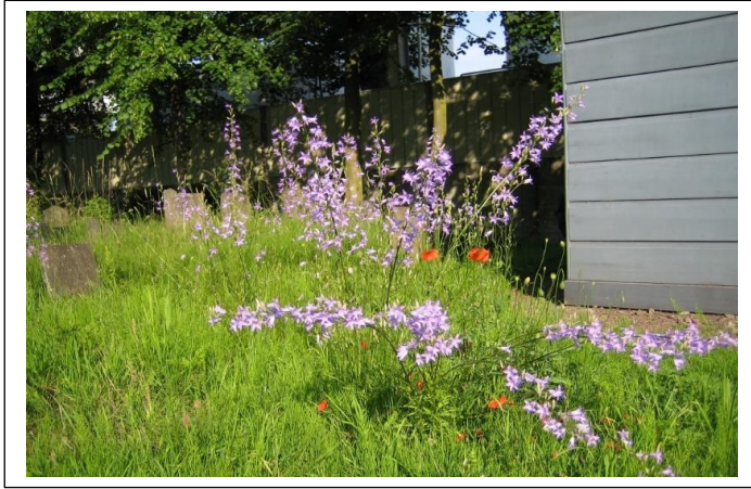
Het bloeiende repeelsteeltje bij het baarhuisje.