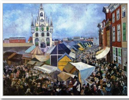
Kermis te Gouda, olieverfschilderij

De Bertelmanstraat loopt van de Calslaan naar de Kramersweg.