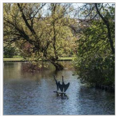
Het van Bergen IJzendoornpark

In 1870 kreeg Gouda een spoorverbinding met Den Haag; In de jaren 80 van de negentiende eeuw werden tramverbindingen aangelegd met Oudewater en Bodegraven; Het scheepvaartverkeer van en naar Gouda nam sterk toe. De aanleg van een waterleiding bleek een gunstig effect te hebben op de volksgezondheid en deed het sterftcijfer dalen.