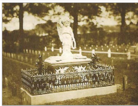
Het ter ere van Kluitman opgerichte monument in Gouda omstreeks 1883

in 1841 een stadsgeschiedenis van Gouda met als titel "Beknopte beschrijving der stad Gouda".[2] Na de beschrijvingen van Walvis en De Lange van Wijngaerden was dit de derde stadsgeschiedenis van Gouda. Het werk werd uitgegeven door Van Goor, in die tijd nog gevestigd in Gouda.