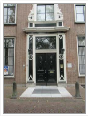
Hoffmanstichting, Oosthaven 52

Bij testament had zij bepaald dat er een aantal jaargelden moest worden uitgekeerd en dat de gemeente Gouda moest stichten "een Volksgaarkeuken, waarmede zij bedoelt, zoodanige inrichting, waardoor aan den Arbeidersstand tegen matige betaling voedingsmiddelen worden verschaft, en een gesticht tot opneming en verpleging van daaraan behoefte hebbende vrouwen of meisjes uit den fatsoenlijken stand".