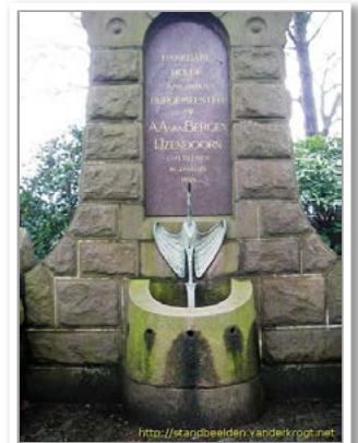
Monument in het Houtmansplantsoen