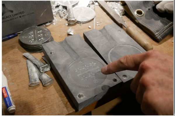
De leistenen gietmal met het Goudse wapen.

Een gietmal werd in Duitsland in leisteen gegraveerd en werd opgestuurd naar de tinnengieter Jaques Vullings - de firma "Glorious Empire", in Maastricht. Hier werden onze plaatjes in tin gegoten en verder bewerkt.