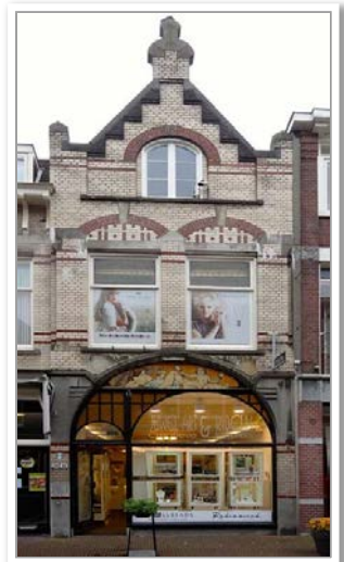
Lange Tiendeweg 18